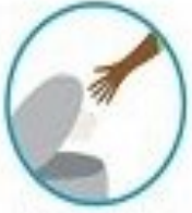
مواظقت سریع دستها. مصرف شده برون سطح زباله