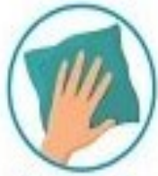
با یک تکه پارچه مرطوب سطحی که افراد مریض با آن تماس دارند