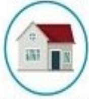
فرقیتمه کردن فود در صورتیکه بیمار هستید یا مشکوک به بیماری هستید