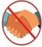
خودتایر از تماس با دیگران