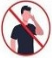
خودتایر از تماس دست شستشو فوری با آب و صابون