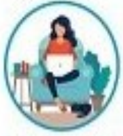
دورکاری در صورتیکه امکان هستید و این امکان فراهم است