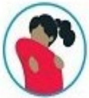
پوشاندن دهان و بینی قبل از سرفه یا عطسه