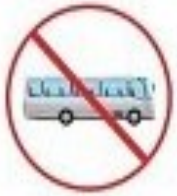
فودهای از برده و سفر های غیر ضروری