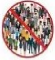
خودتایر از حضور در اماکن شلوغ و擁擠ت