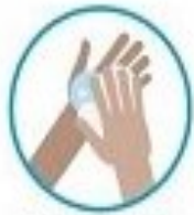
شستشوی مرتب دست ها