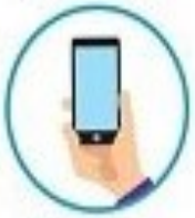
تماس و حضورت با پزشک قبل از مراجعه به مراکز درمانی