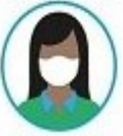
استفاده از ماسک پزشکی در صورتیکه بیمار هستید یا از بیمار جدا به کووید ۱۹ مراقبت میکنید